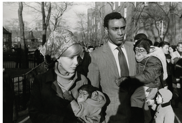
Garry Winogrand (contenuto)