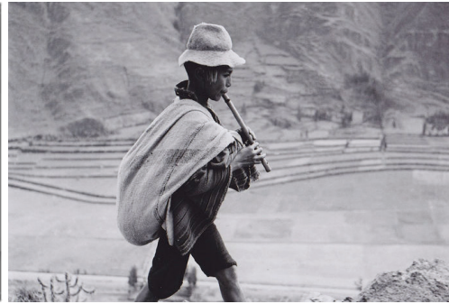
Werner Bischof, "The flute player". Perù (1954).