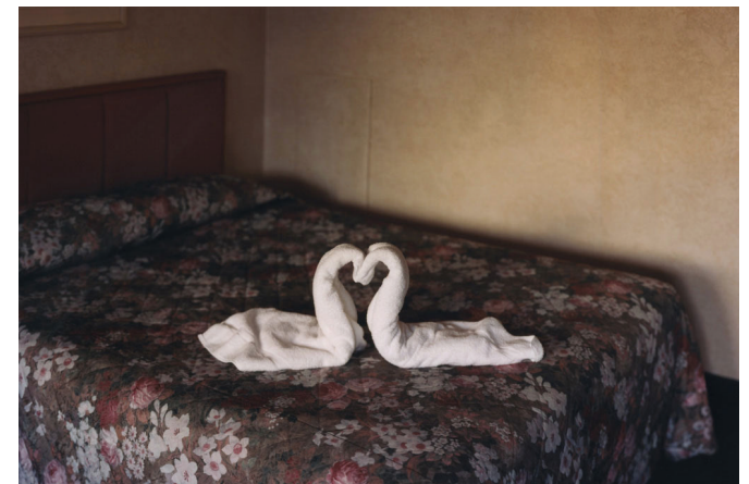
Alec Soth, "Two Towels" (2004).