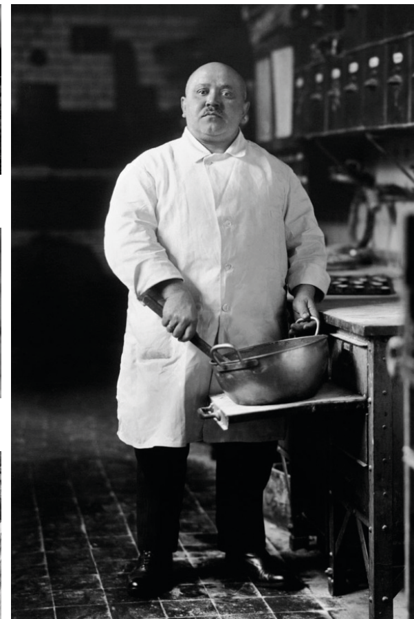
August Sander. Germania (1928)