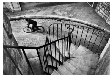
Henri Cartier-Bresson. Francia (1932)