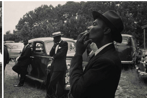
St Helena, South Carolina (1955)