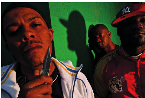
David Alan Harvey