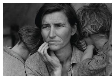
Dorothea Lange, Migrant mother. USA (1936)