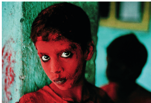
Steve Mc Curry. Bombay, India (1996).