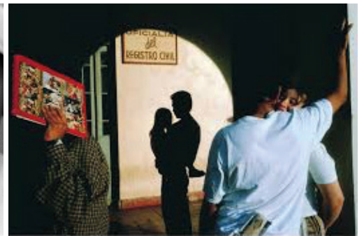
Alex Webb. Nuevo Laredo, Messico (1996).