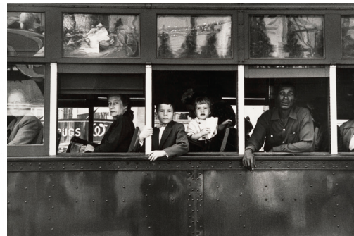
New Orleans (1958)