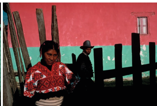
David Alan Harvey