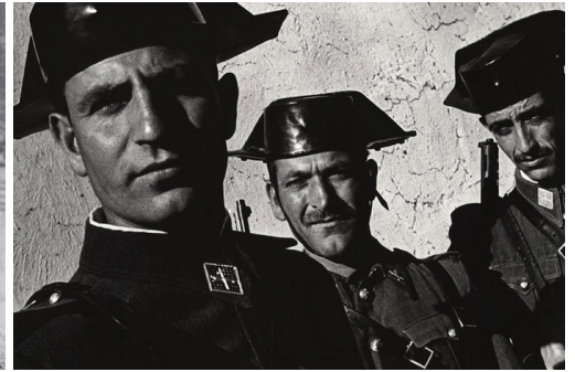
Eugene Smith, "Guardia civil". Spagna (1950).