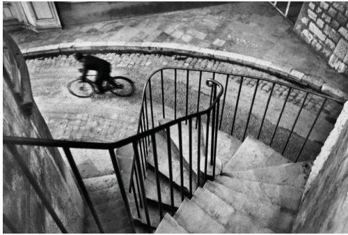
Henri Cartier-Bresson. Hyères, Francia (1932).