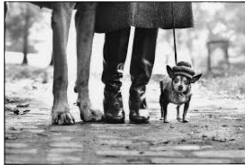
Elliott Erwitt. Wilmington, North Carolina (1950).