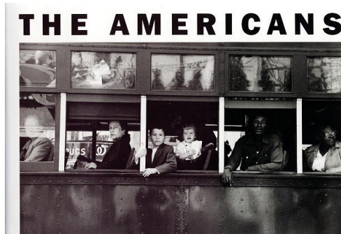
“The Americans” (1958)

“Il bianco e il nero sono i colori della fotografia. Per me simboleggiano l’alternarsi di speranza e disperazione a cui l’umanità è da sempre sottoposta. “. Definito dal New York Time Magazine come “il più influente fotografo in vita”, Robert Frank ha segnato uno spartiacque nella storia della fotografia. Lontano dalle concezioni del momento decisivo di Henry Cartier-Bresson e dalla straight photography americana, il lavoro di Frank ha liberato la fotografia documentaristica dal binomio di oggettività-verità, restituendo una visione fatta di ricerca soggettiva e di emozioni sulla natura dell’esistenza umana. L’America di Frank è un luogo di ombre, reali e metaforiche. Il ritratto di un territorio e dei suoi abitanti che molti non potevano o non volevano vedere: un America triste, difficile, più malinconica che eroica. Una ballata per immagini dedicata alla strada; un reportage che scava dentro il sogno americano per raccontarci l’abisso della sua realtà. Risulta difficile al giorno d’oggi comprendere appieno quanto radicale e sovversiva sia stata la pubblicazione di questo libro fotografico. La tagliente amarezza dello sguardo di Frank ha segnato un’epoca diventando un punto di riferimento per generazioni di fotografi.