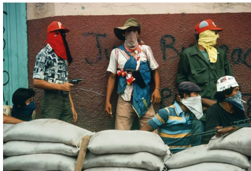
Susan Meiselas. Matagalpa, Nicaragua (1978).