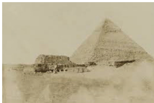
Maxime Du Camp

Ben presto furono comprese anche le potenzialità della fotografia in ambito sociopolitico, come strumento di critica sociale (Jacob Riis, Lewis Hine) ("concerned photography").