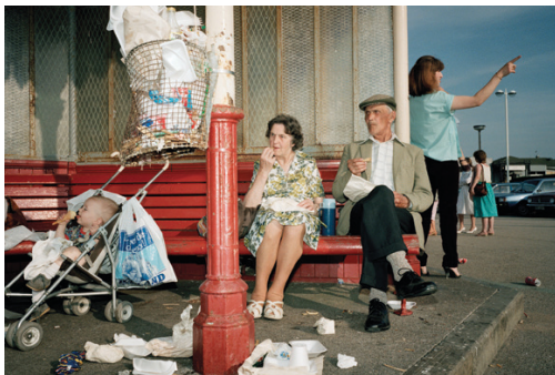
Martin Parr. Brighton, New England (1986).