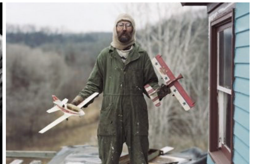
Alec Soth. Dava, Minnesota (2002).