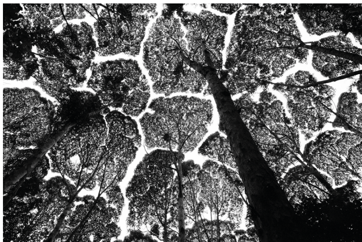
Stuart Franklin (forma)