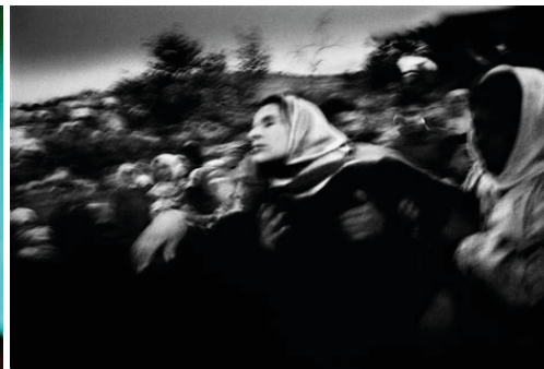
Paolo Pellegrin. Jenin, Palestina (2002).