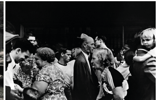
New Orleans (1955)