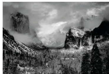
Ansel Adams, Yosemite. USA, 1932

In America Ansel Adams si dedica al racconto fotografico dei vasti spazi incontaminati del territorio statunitense. Realizza paesaggi di straordinaria nitidezza, la poetica del gruppo "f/64" da lui fondato. In Europa August Sander inizia il monumentale lavoro di racconto della società tedesca durante la Repubblica di Weimar (1919- 1933). A seguito della devastante crisi economica del 1929, il governo statunitense guidato da Roosevelt, dà inizio ad un piano di investimenti pubblici il "New Deal". La Farm Security Administration sostiene l'azione del governo finanziando un grande lavoro fotografico di documentazione sulle terribili condizioni economiche dei braccianti agricoli, i più colpiti dalla crisi. Parteciperanno al progetto, fra gli altri, Dorothea Lange e Walker Evans. In Francia Henri Cartier-Bresson percorre una strada modernista (legata al concetto dell'efficienza della macchina e della perfezione della forma) che lo porterà alla teoria del "momento decisivo" applicato al racconto socio-culturale.