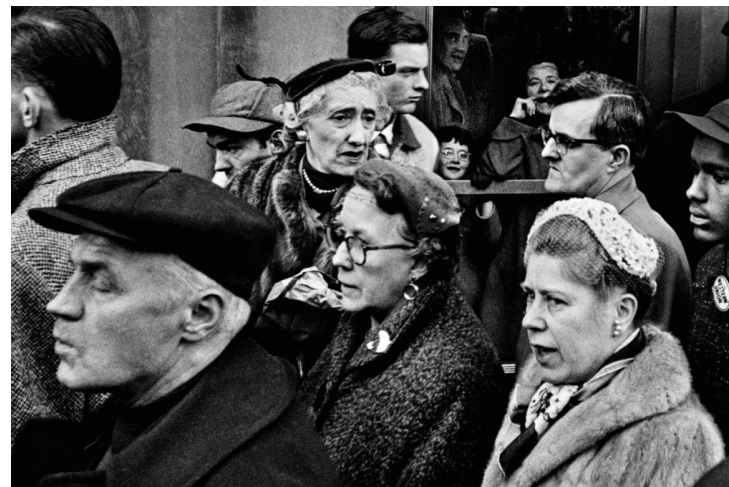
William Klein (caos)