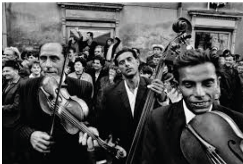
Josef Koudelka. Straznice, Moravia (1966).